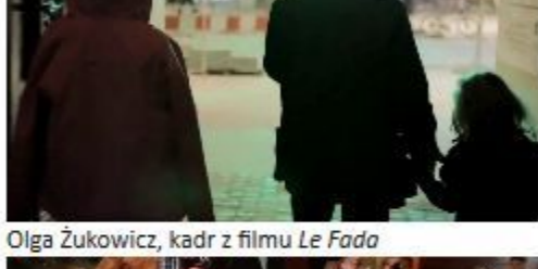
Olga Zukiwicz, kadr z filmu Le Fado