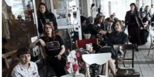
Bartłomiej Tryzna, kadr z filmu Khamelees